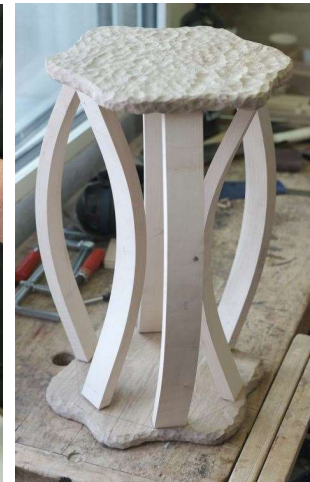
Sycomore et chêne, libre interprétation style Art nouveau