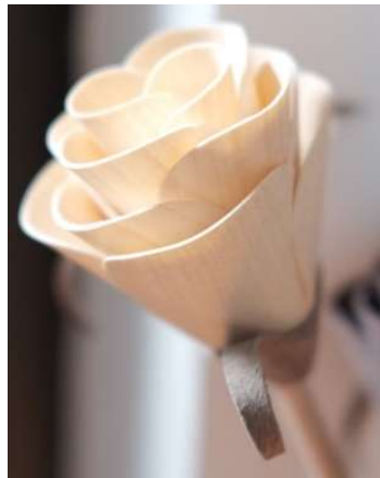
Frêne et noyer