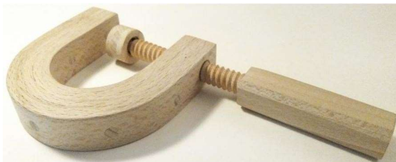
'C', tige filetée et poignée en hêtre

Une fleur permet de comprendre le comportement de bois fin de type placage, un porte-carte également en placage montre les possibilités extrêmes du cintrage.