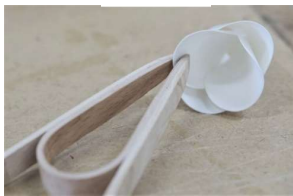
Sycomore ondé décoloré

Une fleur permet de comprendre le comportement de bois fin de type placage, un porte-carte également en placage montre les possibilités extrêmes du cintrage.